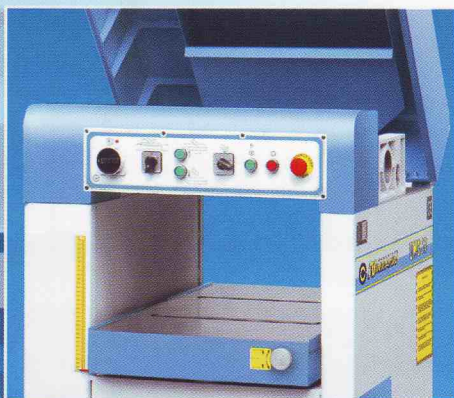
Маса на щрайхмуса с регулируеми ролки Einstellbare Dickentischwalzen Thicknessing planer working table with adjustable rollers