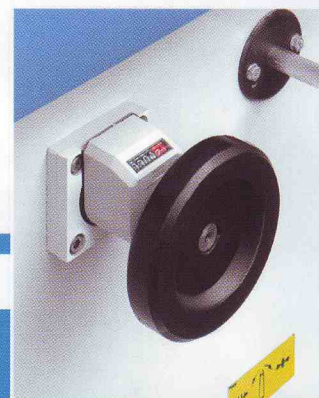
Цифрова индикация за положението на работната маса Digitalanzeige für die Dickentischhöhenverstellung Digital read-out for the working table position